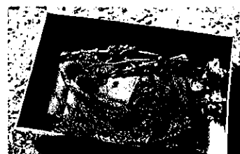
炭焼き体験 花炭 ※写真はイメージです。