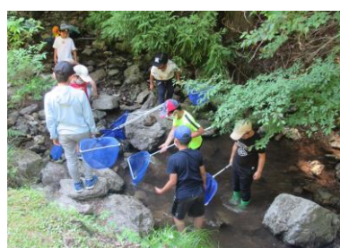
水辺の生きもの観察